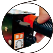
速度旋鈕 SPEED ADJUST