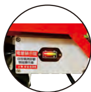
低電量警示 LOW BATTERY