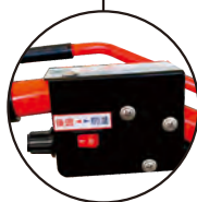
前進後退 FORWARD, REVERSE