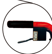
電子手油門 BRAKE LEVER