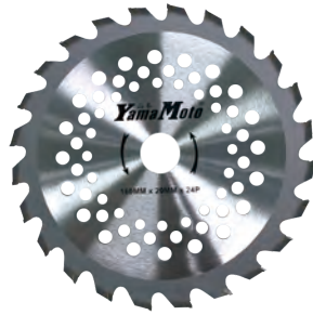
鎢鋼刀片 Tungsten Blade 160mm x 20mm x 24P