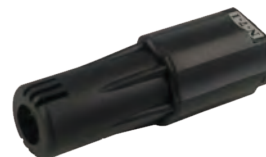
N-7-1 / 7-2 旋轉噴嘴 Rotating Nozzle