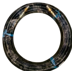
H1出水高壓管-10米 Outlet High Pressure Hose-10M