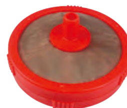
6分過濾網 3/4" Filter