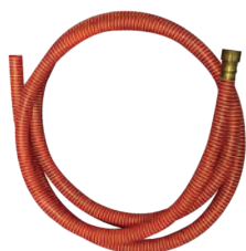
6分9尺吸水過濾管 3/4" Inlet Host Ass'y-9 Ft