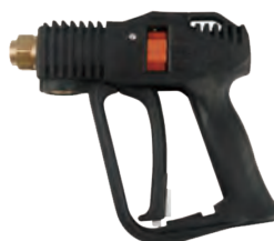
H-280 MAX 2800 psi 32 L/min