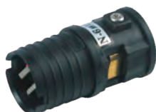
N-6-1 Φ1.2-黑色 N-6-2 Φ1.5-黑色