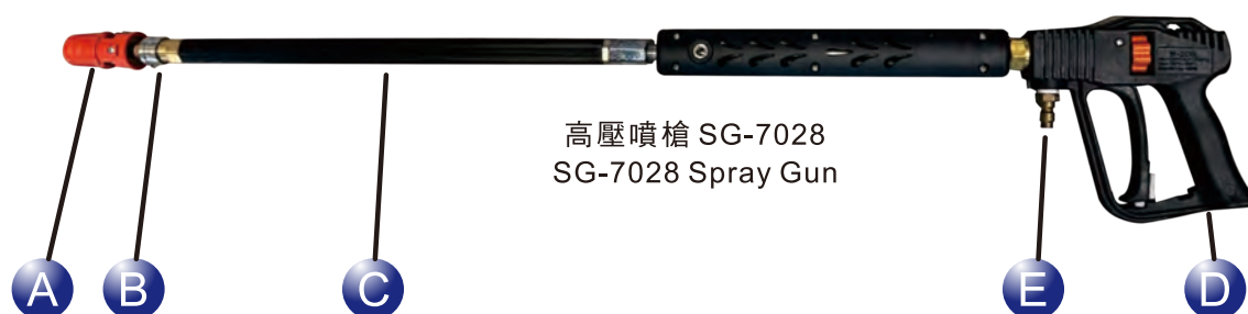
高壓噴槍 SG-7028 SG-7028 Spray Gun