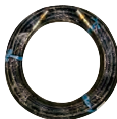
H2出水高壓管-10米 Outlet High Pressure Hose-10M