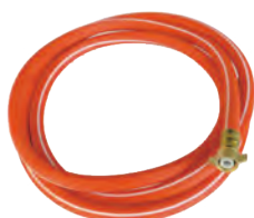
4分九尺迴水管 1/2" Overflow Hose-9Ft