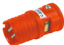
N-6-3 Φ2.0-橘色 N-6-4 Φ1.3-橘色