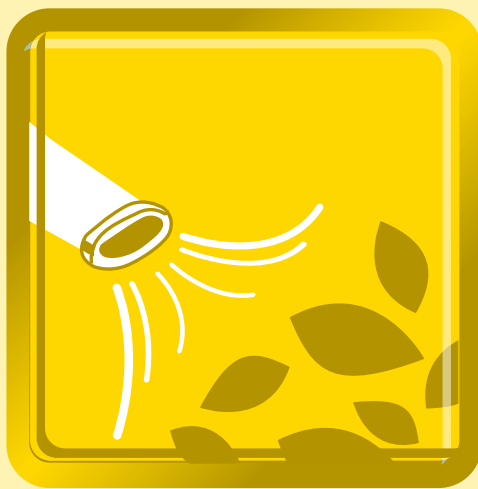
吹風機 Engine Blower

Whole New Engine Design , Powerful Fan Output , Double Filtration System , Best Efficiency and Life